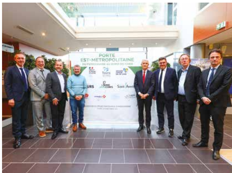
Signature du projet partenarial « Porte Est Métropolitaine » le 6 décembre 2023 à la métropole