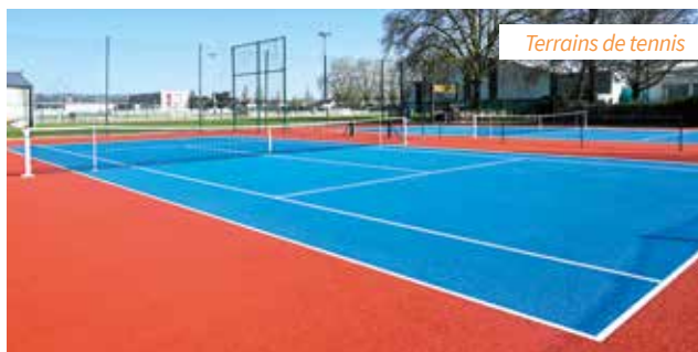
Terrains de tennis