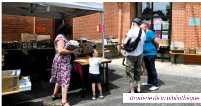
Braderie de la bibliothèque

• Braderie annuelle de la bibliothèque lors de Jours de Fêtes, samedi 13 juin : à la recherche de nouvelles lectures ? La bibliothèque vous propose sa traditionnelle braderie lors du week-end des fêtes municipales. L'occasion de trouver son bonheur à moindre coût ! Profitez également de cette sortie pour participer aux autres activités de Jours de fêtes . Le programme complet des animations est à découvrir en page 39 de votre magazine. ■