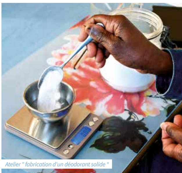
Atelier " fabrication d'un déodorant solide "