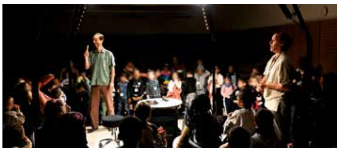
Spectacle Nû de la compagnie Passe Montagne. Une des six représentations qui a accueilli au total 420 enfants de maternelle

La ville a multiplié les séances scolaires, permettant à tous les petits Corpopétrussiens d'assister à une représentation cette saison. « Ce sont 600 enfants de maternelle et 980 élèves d'élémentaire qui se sont rendus au concert du conservatoire, aux spectacles, expositions et / ou sorties de résidence » explique Estelle Goré, en charge de l'accueil avec le public. Pour la première fois, les créneaux scolaires étaient également ouverts à toutes et tous, facilitant l'accès à la culture aux différentes générations. « Pour certains publics, se rendre à un spectacle en soirée n'est pas possible. Une séance en journée peut être ainsi plus accessible. Par exemple, les résidents de la Diablerie ont pu se rendre à chaque spectacle grâce au minibus publicitaire de la ville. Des bénéficiaires des associations partenaires (ID37, Les Ateliers des Possibles, etc.) ont également profité du dispositif. C'est une vraie réussite que nous reconduirons l'année prochaine » conclut Julien Guinebault, directeur des affaires culturelles. ■