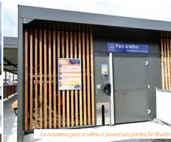
Le nouveau parc à vélos a ouvert ses portes fin février