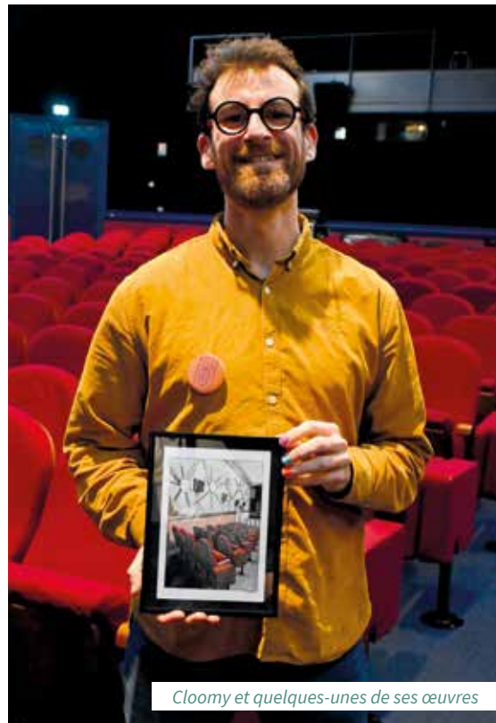
Cloomy et quelques-unes de ses œuvres

Cloomy a déjà repéré de prochains lieux à dessiner. On retrouve notamment le centre commercial des Atlantes dans sa to-do list corpopétrussienne. « Ça me rappelle mes souvenirs d'enfance où je tannais ma mère pour aller au Toys "R" Us (magasin de jouets). Je veux absolument dessiner aussi la chaufferie, un emblème de Saint-Pierre, tout comme le Jérico, un bar que j'affectionne. La gare a bien changé depuis mon