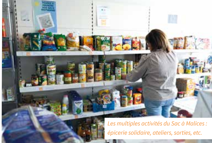
Les multiples activités du Sac à Malices : épicerie solidaire, ateliers, sorties, etc.

Pour bénéficier de l'épicerie solidaire, quelques conditions sont à remplir. « Cette aide est exclusivement réservée aux