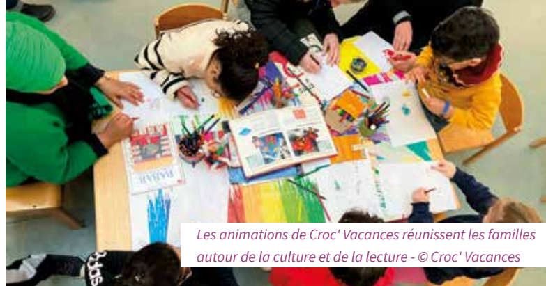
Les animations de Croc' Vacances réunissent les familles autour de la culture et de la lecture

Mais l'objectif principal de l'association est de toucher les familles corpopétrussiennes dans leur diversité. « Nous avons donc décidé de partir à leur rencontre ! Notre première animation à l'extérieur s'est déroulée à l'été 2025 avec la manifestation " Partir en livres ", un événement national qui promeut le plaisir de la lecture auprès des jeunes, sur tout le