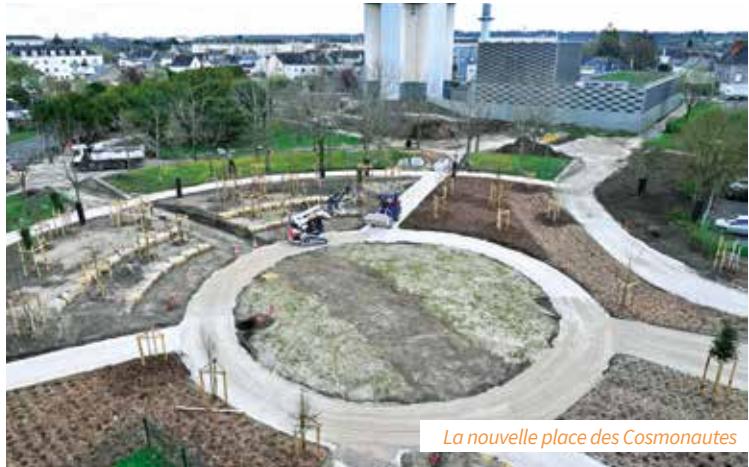
La nouvelle place des Cosmonautes

> Coût de l'opération portée par Tours Métropole Val-de-Loire, avec le soutien financier de la région Centre Val-de-Loire, de l'ANRU (Agence nationale pour la rénovation urbaine), du Fonds vert de l'État et de Val Touraine Habitat : 1 600 000€ ■