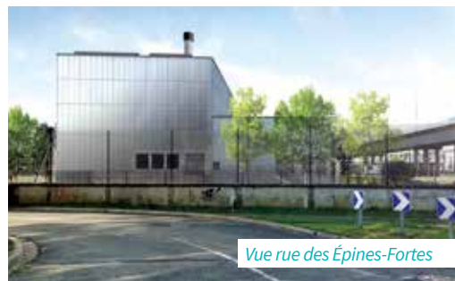
Vue rue des Épines-Fortes