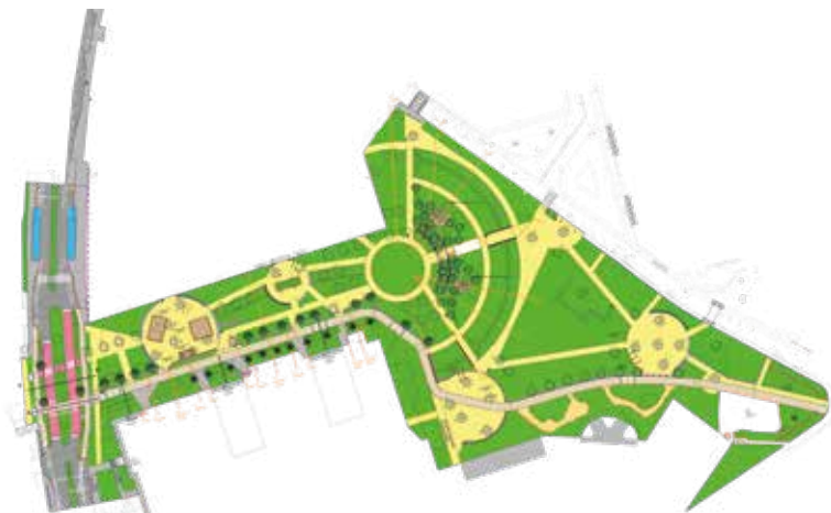
Plan d'aménagement du Grand-Mail (est) et place des Cosmonautes

> Coût total prévisionnel de l'opération : 1 500 000€ TTC (subventionné par l'ANRU, Agence nationale pour la rénovation urbaine) ■