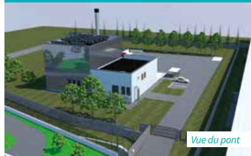
Vue du pont

Dès 2025, la rue des Épines-Fortes accueillera le chantier d'une nouvelle chaufferie biomasse, à l'est de la ville, pilotée par Corpo Energie. Sur le même principe que celle de la Rabaterie, cette chaufferie utilisera le bois comme combustible. Écologique, cette solution de chauffage garantit également une meilleure stabilité des prix pour les usagers et la collectivité. Mise en service prévue en fin d'année 2025. ■