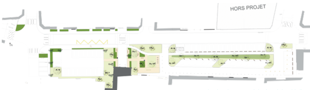
Plan d'aménagement de la place de la Médaille

> Coût total prévisionnel de l'opération : 800 000€ TTC ■