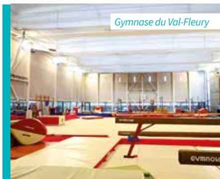
Gymnase du Val-Fleury

Il pourra être accompagné d'une démarche collaborative en impliquant les élèves, enseignants et parents afin de créer les conditions d'une belle opportunité pédagogique car il est important de sensibiliser les plus jeunes aux enjeux climatiques. ■