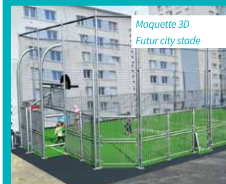
Maquette 3D Futur city stade