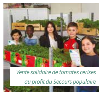
Vente solidaire de tomates cerises au profit du Secours populaire