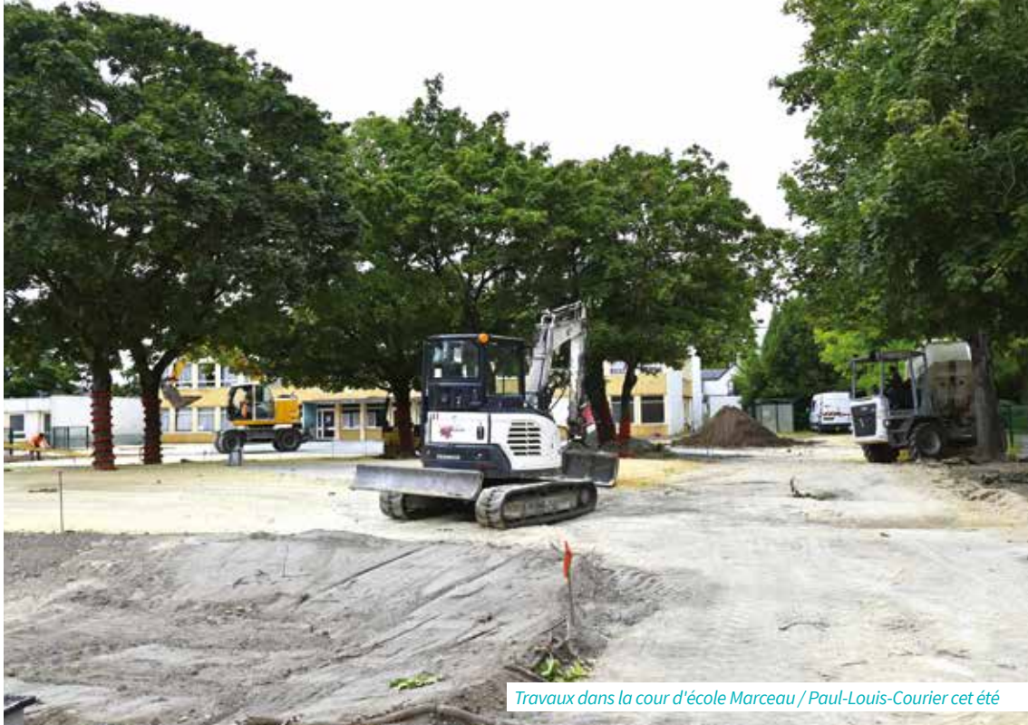
Travaux dans la cour d'école Marceau / Paul-Louis-Courier cet été

• Horaires : lundi, mardi, mercredi et vendredi de 8h30 à 12h30 et de 13h30 à 17h et jeudi de 8h30 à 12h30 ■