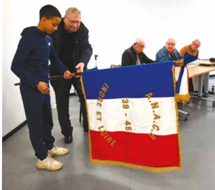
Les anciens combattants ont présenté leur histoire et leur mission de porte drapeau au Conseil municipal des enfants en avril 2023

Cette année, la France commémore le 80 e anniversaire de la libération française pendant la Seconde Guerre mondiale. Sur Saint-Pierre-des-Corps, le comité local ANACR est présent pour rassembler les anciens résistants et transmettre leur mémoire.