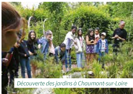
Découverte des jardins à Chaumont-sur-Loire

> Dépôt de candidature pour les élèves de CM1 : Virginie Sanchez, animatrice du CME, se rendra dans toutes les écoles au mois d'octobre pour présenter le CME aux classes de CM1 et donner les dossiers de candidatures aux élèves intéressés. Élections après les vacances d'automne. Les enfants élus devront être disponibles un mercredi matin par mois pour les réunions de commission ainsi que pour les cérémonies. Pour plus de renseignements, contactez Virginie Sanchez à l'adresse mail suivante : v.sanchez@mairiespdc.fr