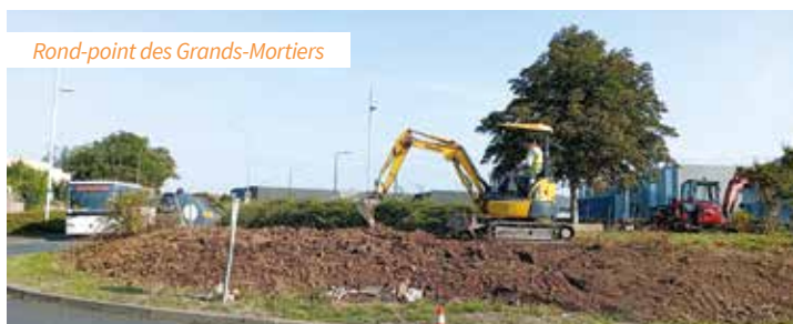
Rond-point des Grands-Mortiers

• Dans la zone industrielle, le service aménage le rond-point des Grands-Mortiers. Toutes les plantes ont été retirées afin de redéfinir l'espace. La pente du rond-point a été adoucie pour donner une meilleure visibilité aux automobilistes. Des nouvelles espèces végétales et arbres seront prochainement plantés. ■