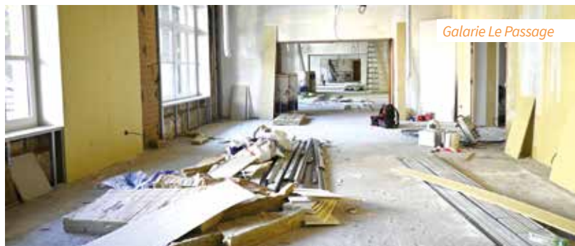
Galerie Le Passage