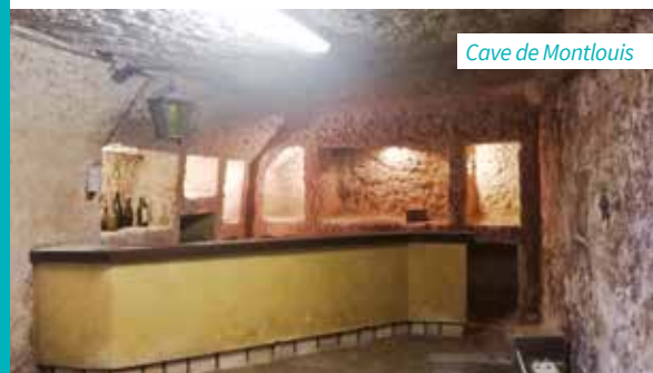
Cave de Montlouis