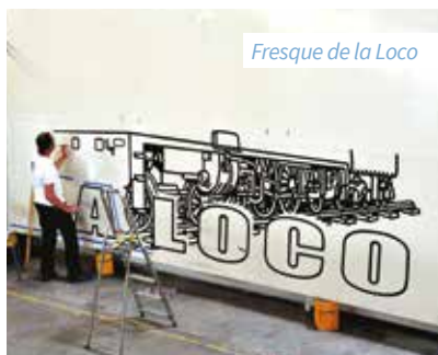
Fresque de la Loco