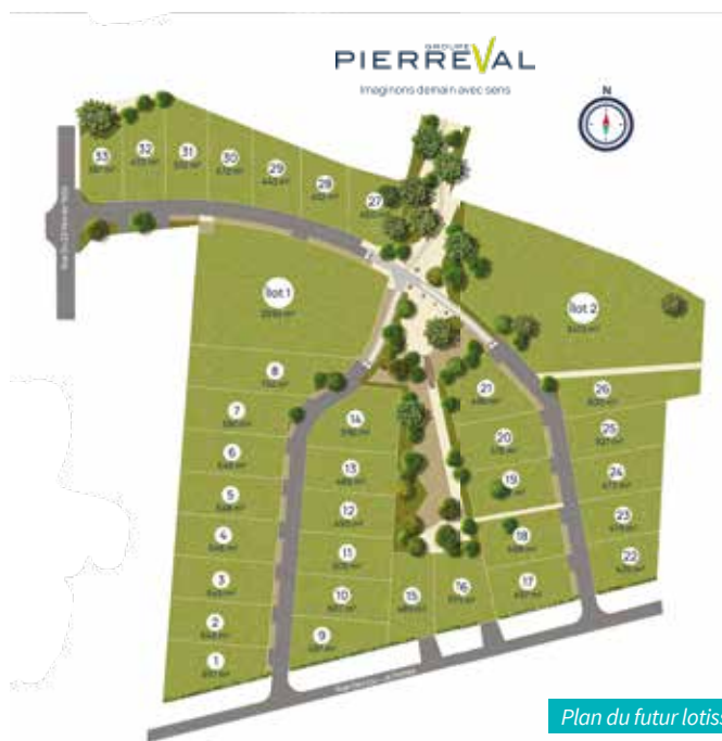
Plan du futur lotissement

> Plus d'informations pour l'achat d'une parcelle ? Contactez le groupe Pierreval pour poser vos questions au 02 55 96 00 30 / 06 70 99 51 77 et sur www.pierreval.com