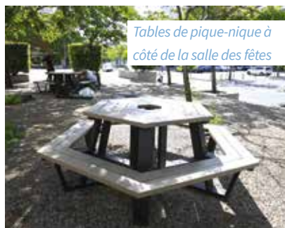
Tables de pique-nique à côté de la salle des fêtes

> Budget participatif 2024 : jusqu'au 30 novembre, votez pour vos 3 projets préférés en page 10 et déposez votre bulletin dans l'une des urnes mises à votre disposition (mairie, bibliothèque, espace famille et maison de l'Aubrière) !