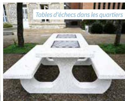
Tables d'échecs dans les quartiers