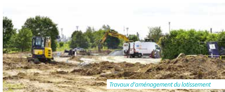
Travaux d'aménagement du lotissement