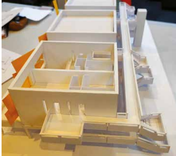
La maquette de l'habitat participatif