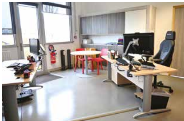
À gauche, les nouveaux locaux des archives. À droite, l'un des nouveaux bureaux des ressources humaines.