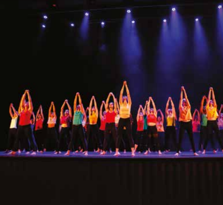
Les danseuses de Choréa Corps en spectacle