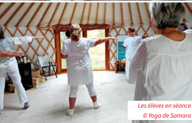
Les élèves en séance