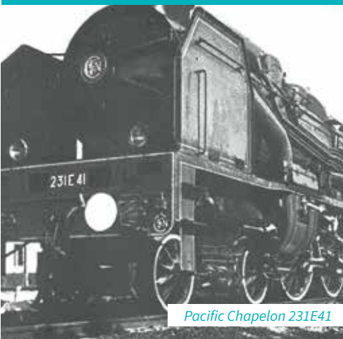
Pacific Chapelon 231E41