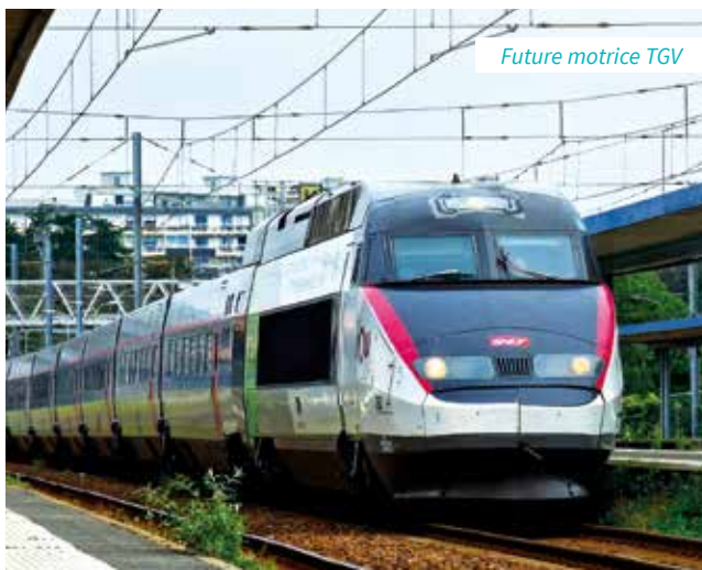
Future motrice TGV

Sur place, des lettres géantes aux initiales de la ville - " #SPDC " - installées mi-novembre, accueilleront la nouvelle locomotive. L'endroit a également bénéficié de travaux sur la partie espaces verts en fin d'année 2025. ■