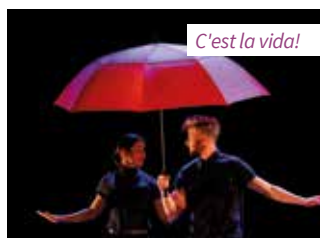
C'est la vida!

• Ateliers " punch needle " (18 février) et " tufting duo " (21 février) à la bibliothèque : pendant les vacances scolaires, l'espace Micro-folie vous propose de tester deux activités manuelles liées au textile : le " punch needle ", une technique de broderie en relief et le " tufting ", une technique de tissage artisanal pour la fabrication de tapis. Ouvert à tous dès l'âge de 10 ans, sur réservation, de 14h à 17h. Présence d'un adulte nécessaire pour l'atelier " tufting duo ". Plus d'infos au 02 47 63 43 25. ■