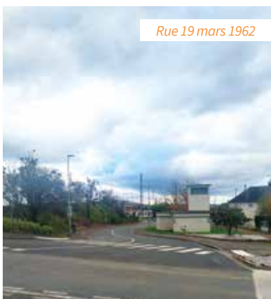
Rue 19 mars 1962