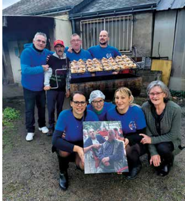
Les membres de l'association réunis devant leur local, en préparation des spécialités du jour

Depuis la fin des années 70, l'Association Musico Culturelle de la Jeunesse Portugaise en France (AMCJPF) – Les colombes blanches, partage la culture portugaise aux Corpopétrussiens. Aujourd'hui, Clarté rencontre ses bénévoles engagés au quotidien dans de multiples actions.