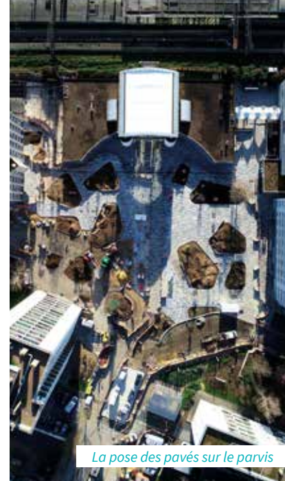
La pose des pavés sur le parvis

> Vous avez une question sur le chantier ? Pour rappel, des réunions avec les riverains sont organisées tous les mardis de 9h à 9h30 sur le parvis de la gare.