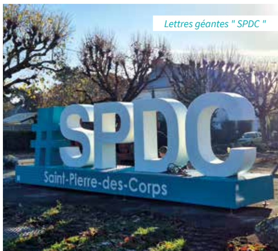
Lettres géantes "SPDC"