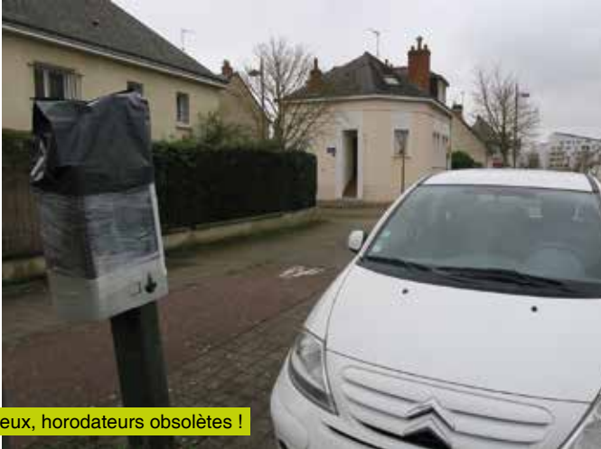
Adieux, horodateurs obsolètes !

→ Les anciens horodateurs ont été remplacés par de nouveaux, qui devraient être opérationnels courant février. Ils permettront de payer par carte bancaire ou avec son smartphone en complément des espèces.