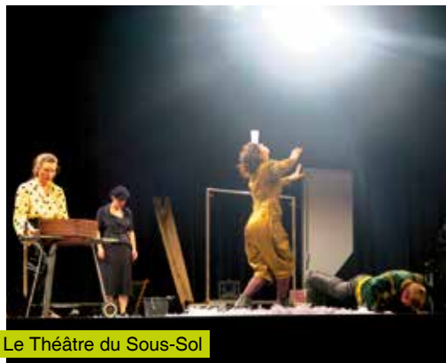
Le Théâtre du Sous-Sol

« Ce n'est pas toujours facile de trouver des salles de spectacles pour répéter et il faut être efficaces. Il faut bien avancer pour profiter des infrastructures mises à notre dis-