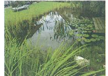
Une mare bien conçue s'auto-régénère.