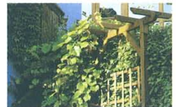
Si la pergola protège surtout des regards et du vent, les habitants apprécient l'ombre qu'elle dispense.

« Dès le début de la Renaissance, l'Italie trouve un regain d'intérêt pour la campagne. Les villas de la Rome antique inspirent le peintre Raphaël, l'architecte Palladio et beaucoup d'autres artistes. Le jardin, trait d'union entre l'édifice et la nature, forme alors un tout indissociable de villas aux noms enchanteurs : la villa Madame à Rome, le palais du Te à Mantoue, la villa d'Este à Tivoli ou la villa Barbaro à Mase. »