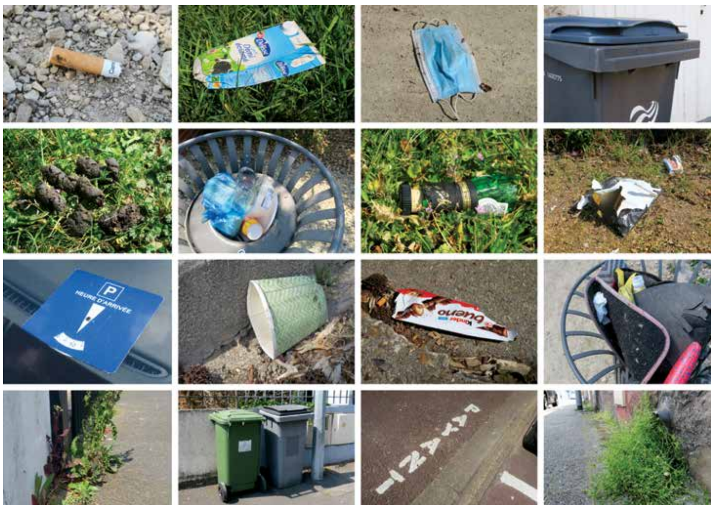
Photos prises le 22 avril dans différents quartiers de la ville